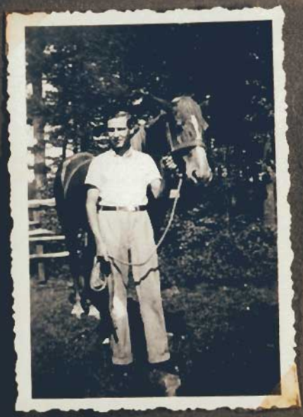
1934 Ein Monat