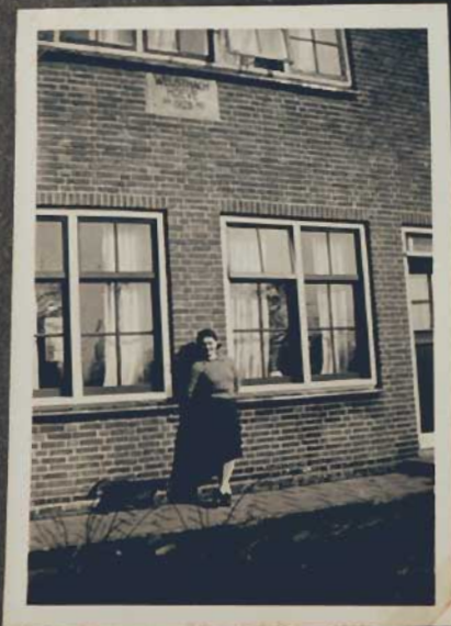
In der Sonne