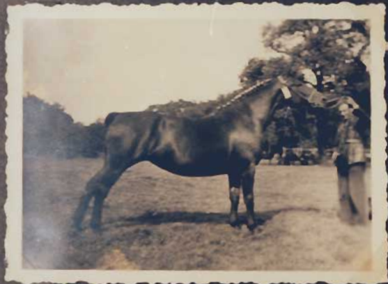
Noch iets vooruit