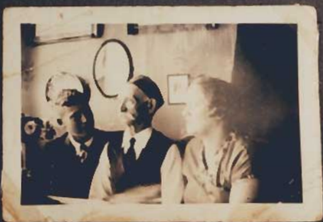
Bei Vater zu Hause...