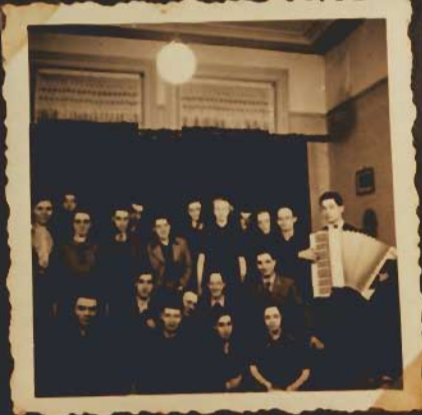
Swit Menge fo