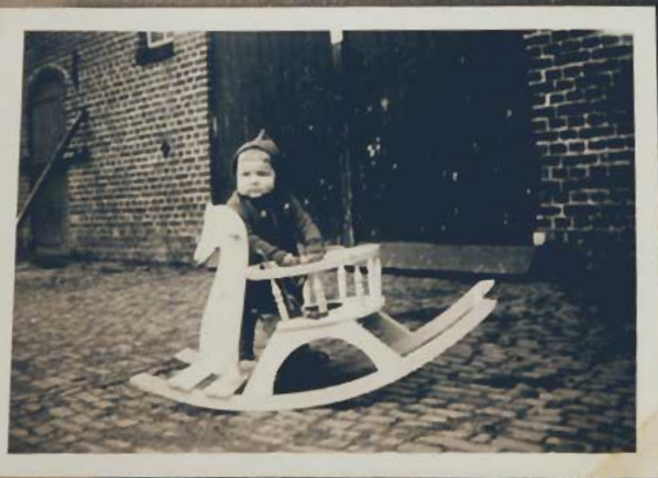
Ik ga schommelen