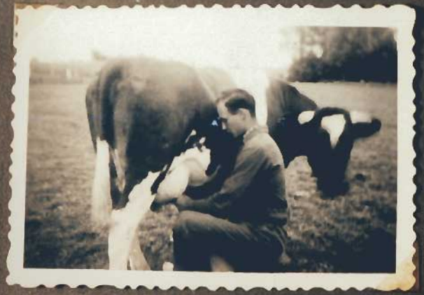
Die gibt viel heute -