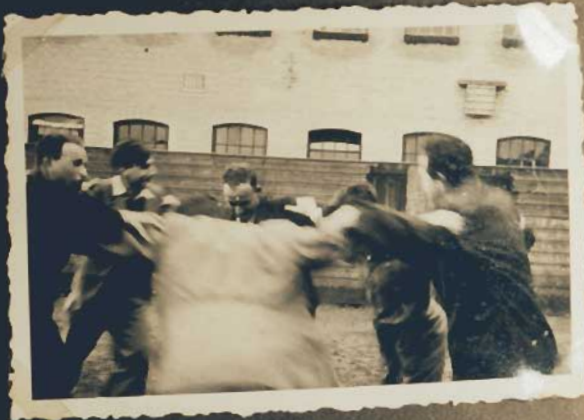
Ein Horra vor dem Schoolgebäude.