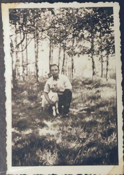
In freier Natur