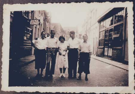
Ha, ha, ha