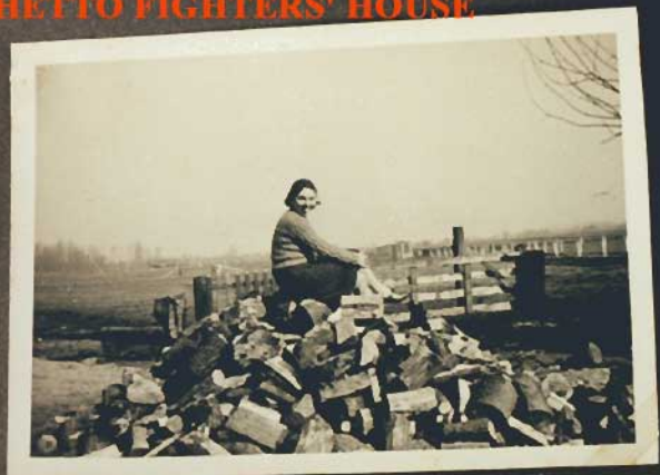
Die schöne Zunge