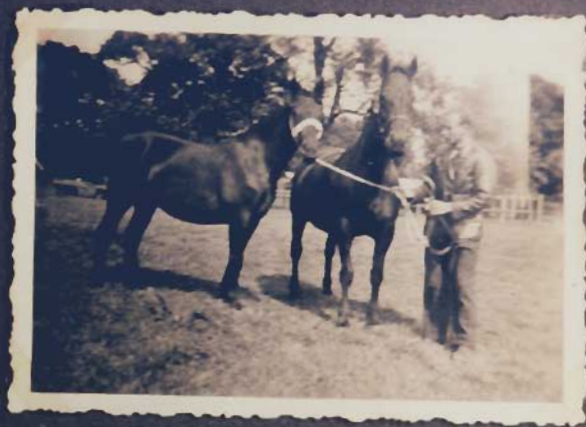
tweede en derde prijs