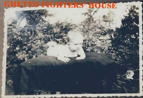
Hopla, daar ben ik