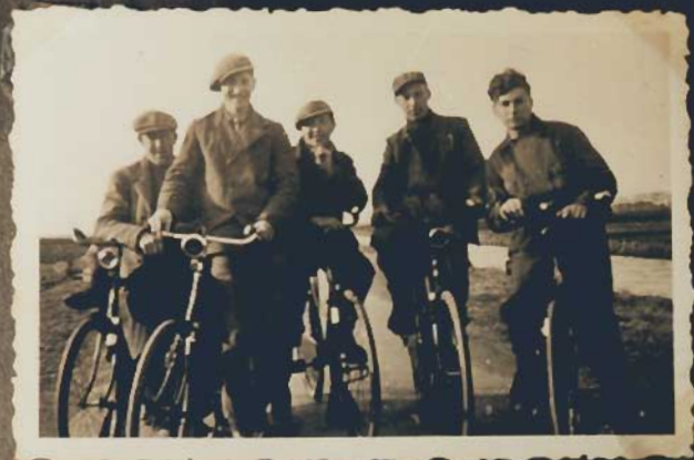
Wo bleibt Beu Rema?