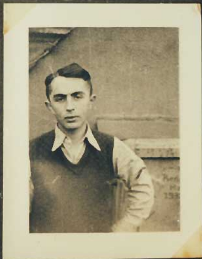
Man hat's nicht leicht