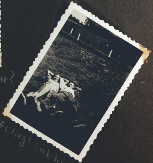
Es liegt sich hier gut