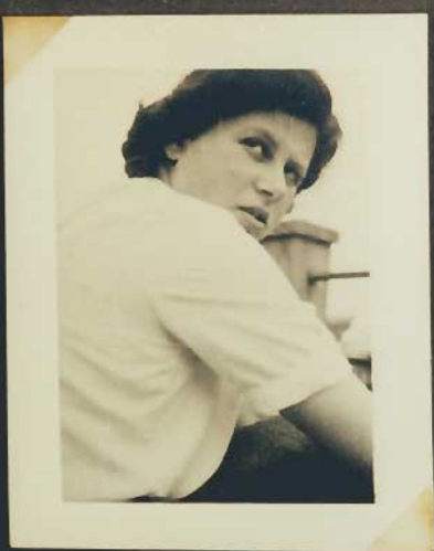
Schau' nicht so blöd