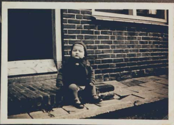
Ik ben Boekoeksannie!