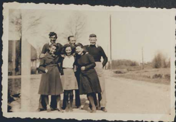
Auf dem Wege nach Westerbobk