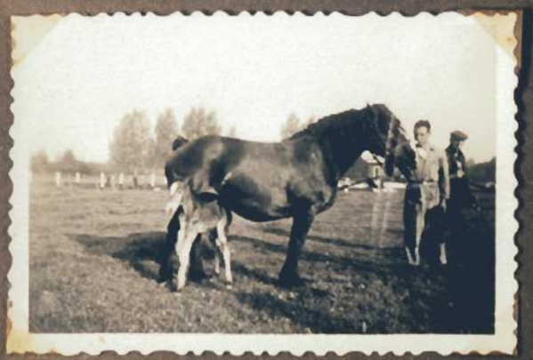
Der erste Tag