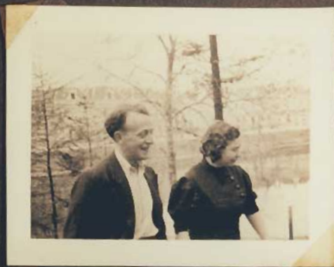
Sehr nett, heute -