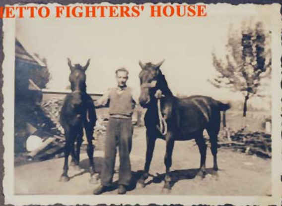
Hola, even wachten