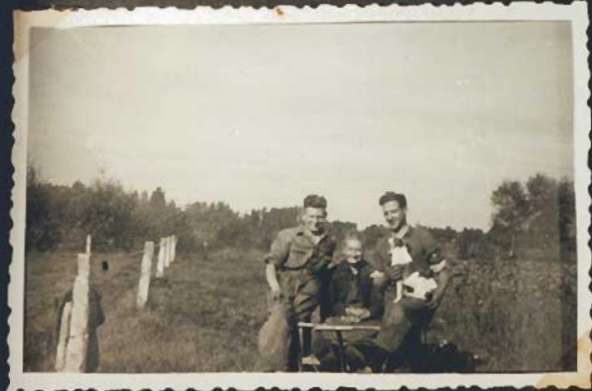
O, Johanna... -