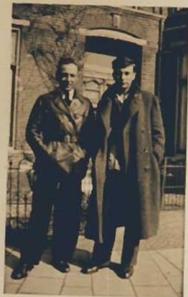
Samm und ich