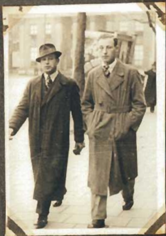
Ein Spaziergang in Groningen