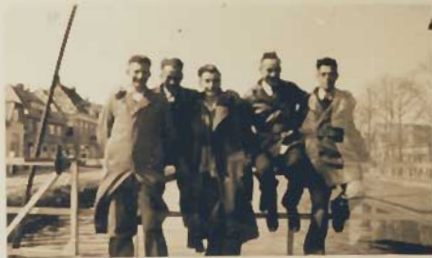
los auf, drück' mich nicht in's Wasser!