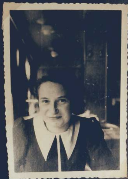
Was sagtest Du?