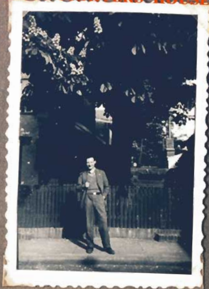
Vor meiner Villa