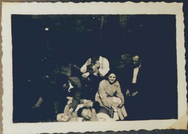
Beim jungen „Keekeek“