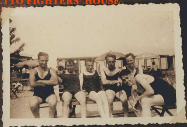
Michel bück' Dich