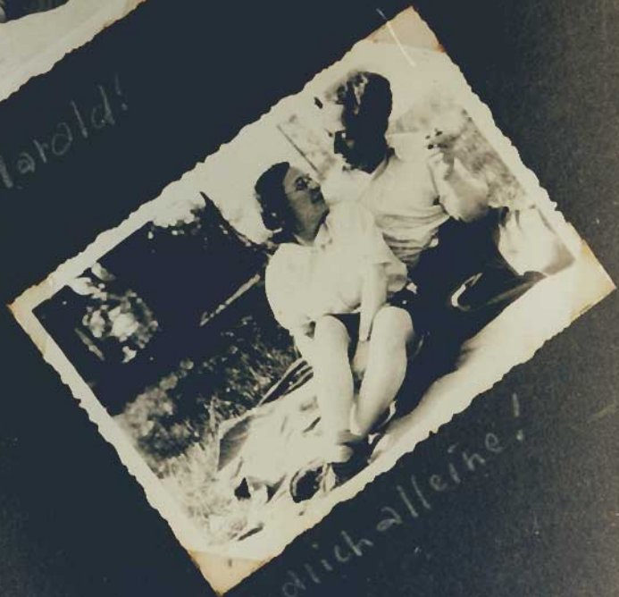
Endlich alle! He!