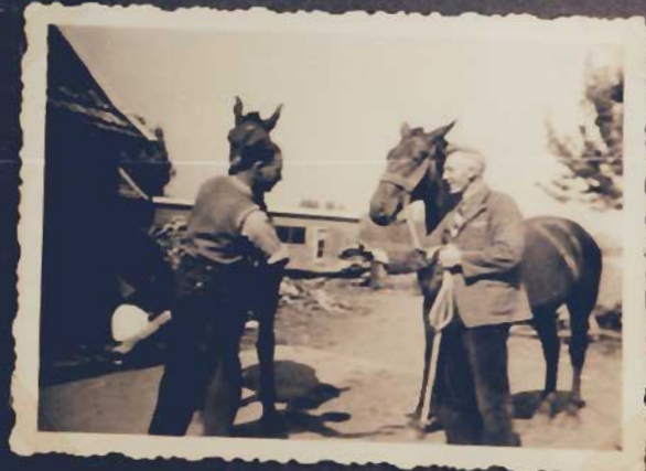
...Veel te duur