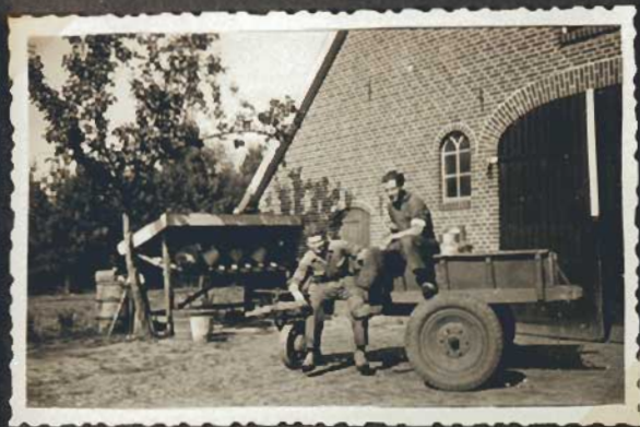
Is de pannenkoek al klaar?