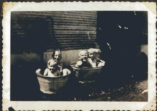
hé, wat lekker is dat toch!