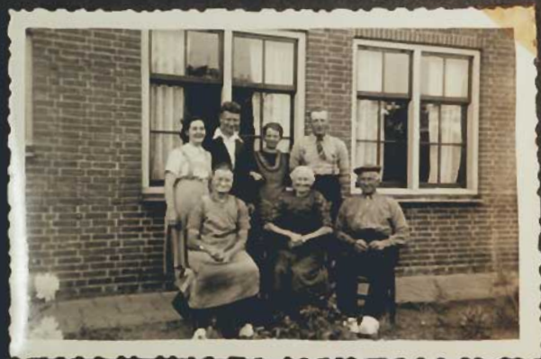
Op de Koekoek