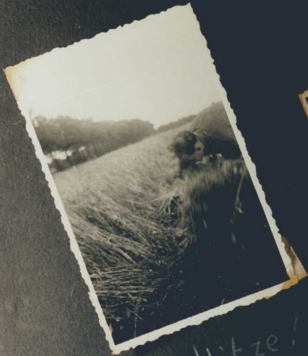
Eu, eine Mitze!