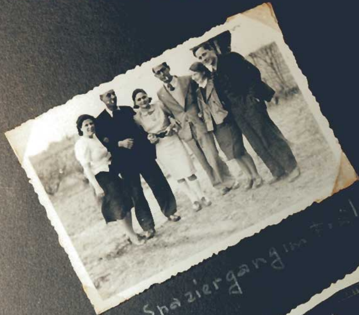
Ein Spaziergang im Park Billie