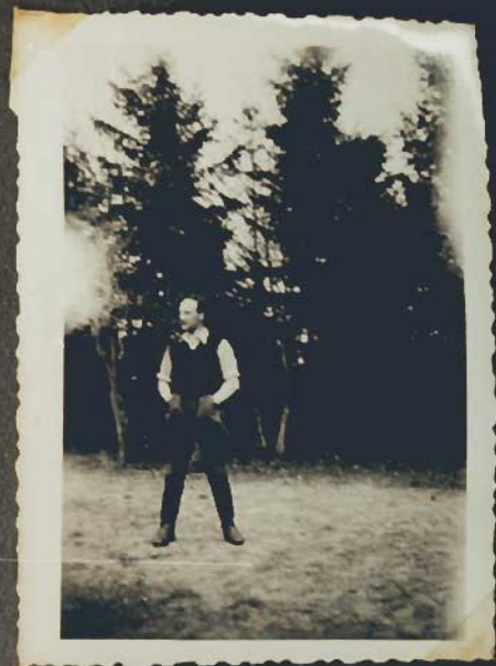
Auf meinem Gut. -